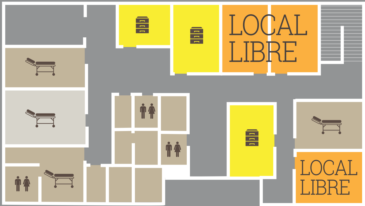
plan du rez-de-chaussée